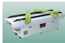
ダブルゲート検針機 ATTER-900LC2