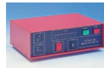
据付型鉄片検出器 ATTER-DS(コントローラ)