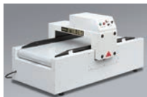
デスクトップコンベヤー ATTER-S104