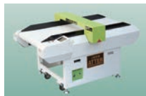
コンベヤー式検針機 ATTER-900LC1