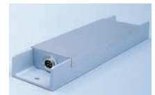
据付型鉄片検出器 IPD-9AS(センサ)