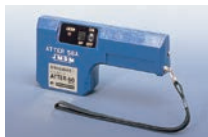
ハンディ型検針器 ATTER-58A